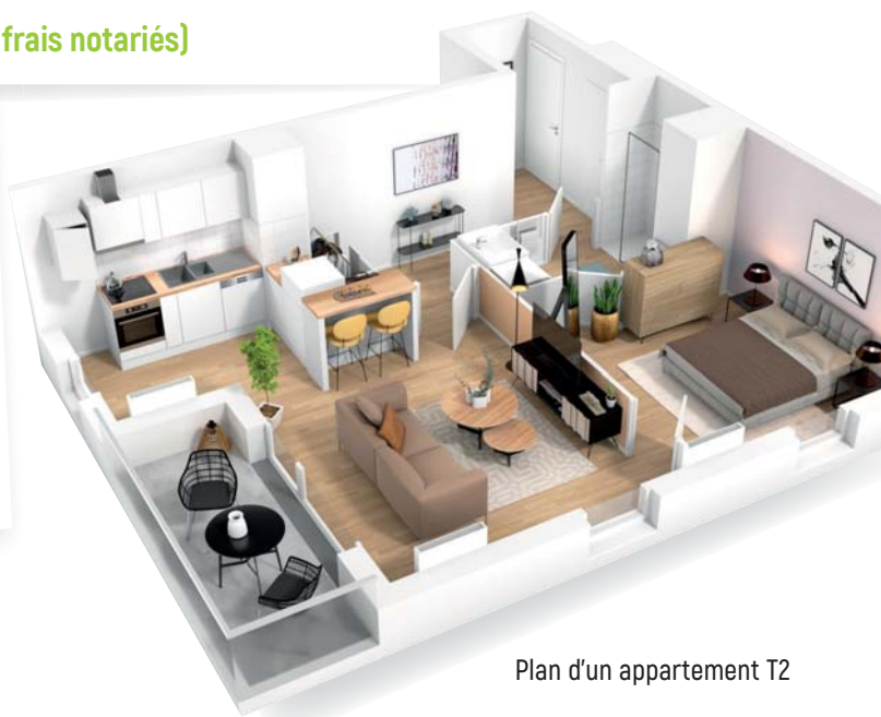
Plan d'un appartement T2